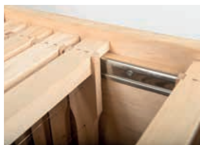
Zarge Zander Weymouthkiefer Detail