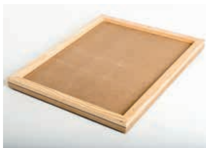
Deckel MDF Fichte