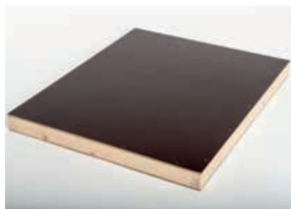
Deckel Zander gedämmt Weymouthkiefer