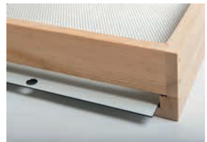
Boden Weymouthkiefer Rückseite Varroaschieber