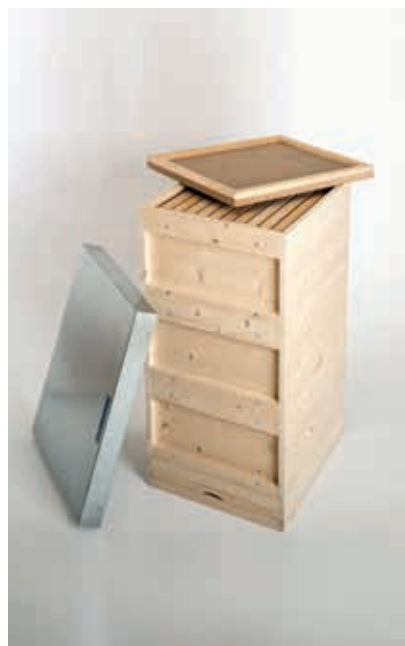
Metalldeckel und Komplettbeute Fichte