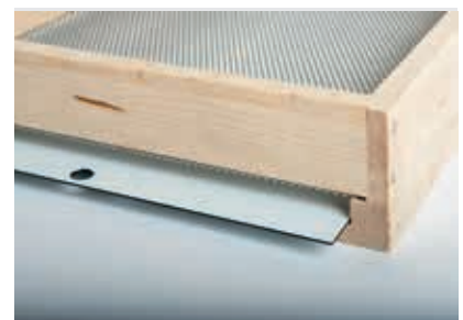
Boden Fichte Rückseite Varroaschieber