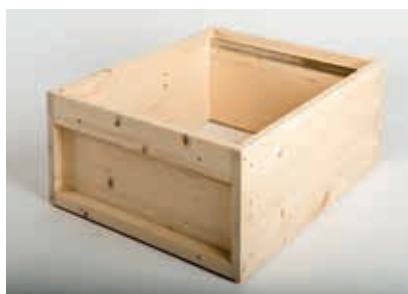
Zarge Zander Fichte